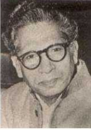
Harivanshrai Bachchan is known for his works such as Madhushala and Agneepath

જો કે, તે ઓગણીસમીની શરૂઆત સાથે જ છે સદી કે હિન્દી ગદ્ય પોતાની રીતે આવ્યું. ભારતેન્દ્ર હરિશંદ્ર હિન્દીમાં નાટકોનું નિર્માણ કરનારા સૌથી પહેલાના એક હતા જે હતા અનુવાદો ના પાઠો લખાયેલ માં સંસ્કૃત અને અન્ય ભાષાઓ. હિન્દી સાહિત્યને સમૃદ્ધ કરનાર અન્ય નામોમાં મોટા પ્રમાણમાં છે મુનશી પ્રેમચંદ, WHO સ્વિચ કર્યું ઉર્દૂ થી ઉપર હિન્દી.